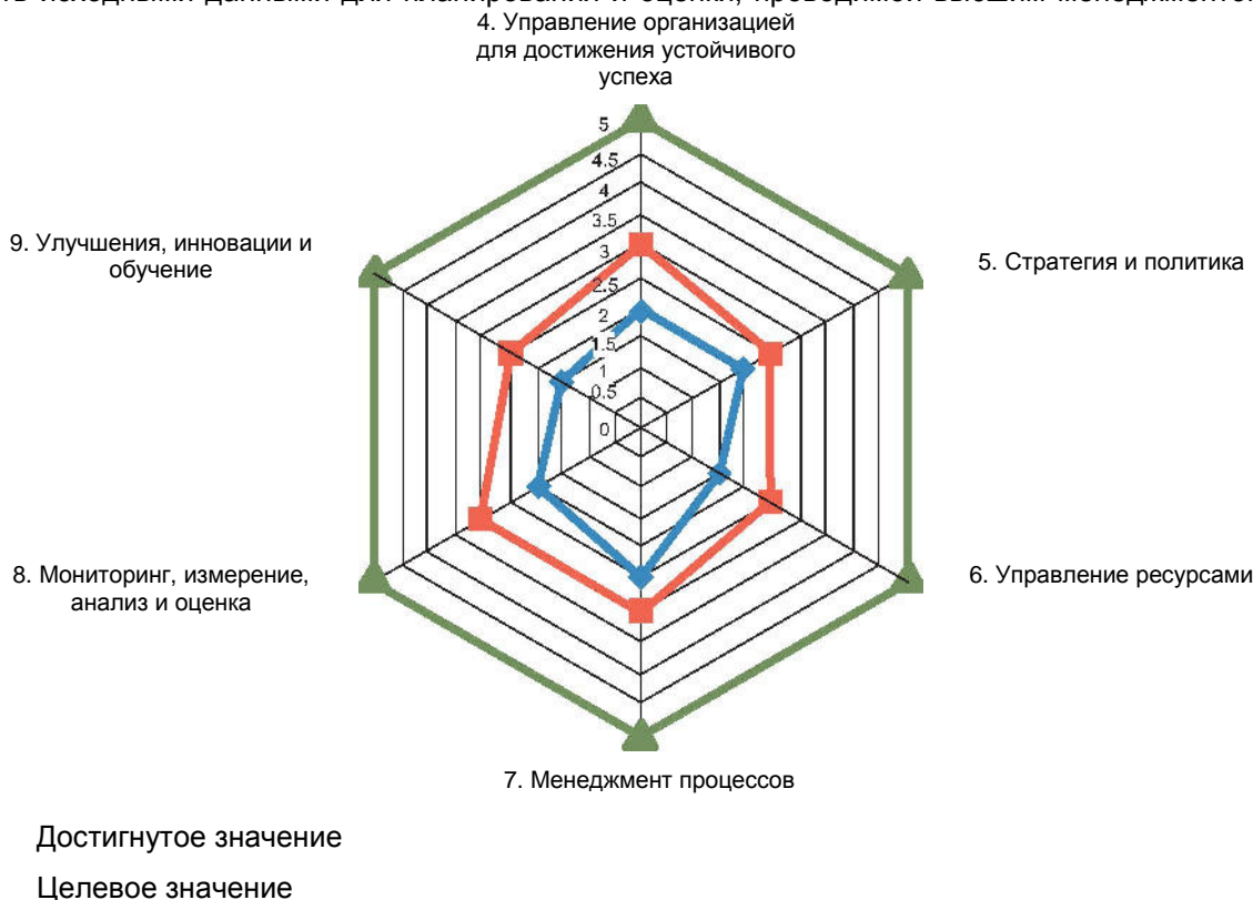
Рисунок А. 2 – Пример представления результатов самооценки

Результатом самооценки должен быть план действий по улучшению и/или инновациям, который должен служить исходными данными для планирования и оценки, проводимой высшим менеджментом, на основе